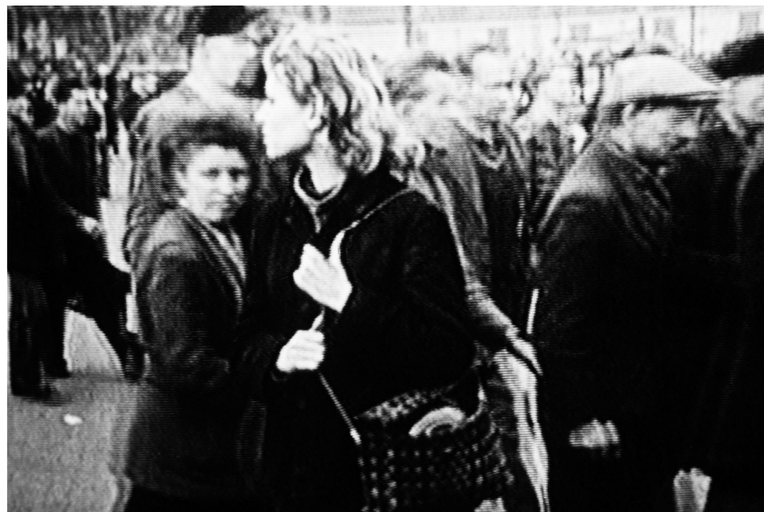
Workers Leaving the Factory in Eleven Decades >> in tranzitdisplay Prague

Ici le mouvement balancera entre le travail considéré comme outil ultime de soumission à l'ordre social et de discipline collective et comme moyen d'émancipation. Premier mouvement : «Ne travaillez jamais !», cri de colère lancé comme un défi par Guy Debord, écrit à la craie sur un mur de la rue de Seine à Paris, un jour (une nuit ?) de 1953. Appel sous forme de mot d'ordre choc qui sera largement repris en 1968, un refus comme base d'une critique sociale depuis au moins Le droit à la paresse de Paul Lafargue, publié en 1880. Comprendre comme : ne vous aliénez pas, ne nourrissez pas la vorace machine capitaliste, ne vous soumettez pas, ne renoncez pas. Aujourd'hui, alors que le chômage inquiète et occupe les esprits, que faire de ces appels ? Cela demeure les marques d'une résistance à ce que Debord nomme lucidement dans le Commentaire à la société du spectacle «l'accom-