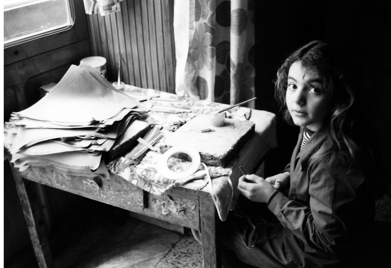
Mimmo Jodice, Napoli, 1973

Lieux Fictifs s'associe à l'événement Du Travail ! en organisant un workshop de 10 jours, au sein des « Ateliers de cinéma » de la prison des Baumettes. A partir des séquences filmées dans Labour in a single shot , présenté dans l'exposition Empathie , les étudiants et les personnes détenues s'interrogeront ensemble sur leur relation au travail et produiront une série d'autoportraits en plan séquence.