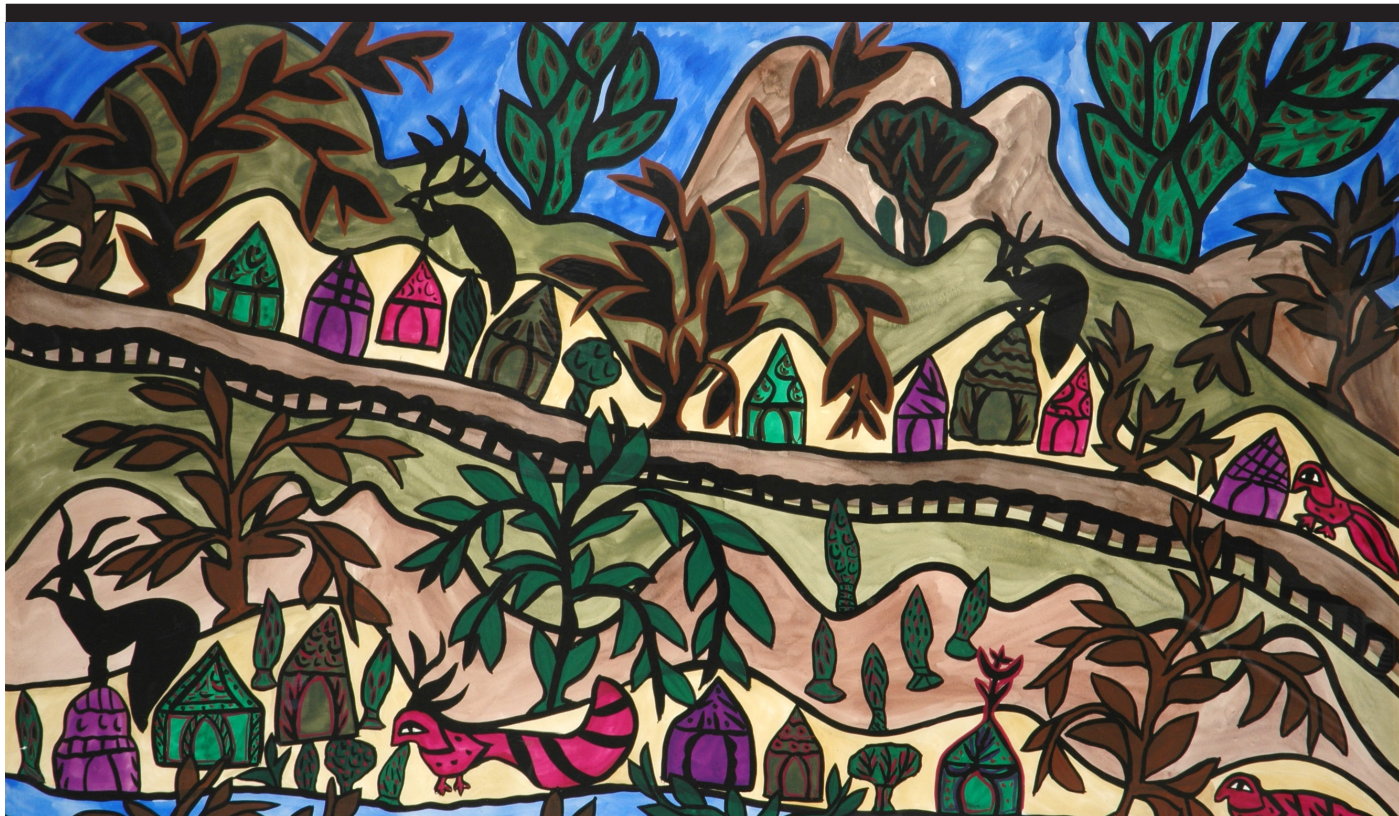
Baya, Paysage aux maisons et collines, gouache sur papier, 1966, FNAC 29677, Centre national des arts plastiques, Dépôt au Musée du Quai Branly.

Le parcours s'ouvre sur deux œuvres en vis-à-vis, initiant dès l'entrée une relation entre extérieur et intérieur, ce que je vois et ce que je ressens.