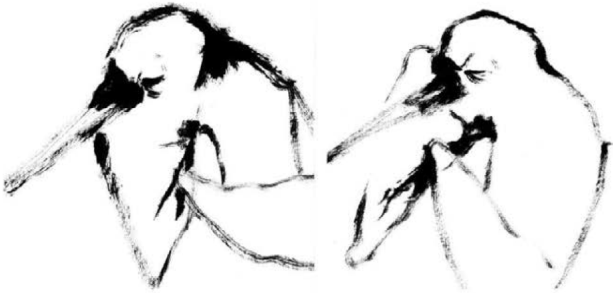
Nawel Louerrad, Sans titre , 2020, wall paper, 6m x 2,60m.

Nous passons quotidiennement d'un espace à un autre, extérieur ou intérieur, de manière physique et symbolique. Les frontières sont poreuses, et parfois un même espace est multiple. Ainsi la sphère privée ou intime, peut s'inviter sur la place du village ou se dévoiler les réseaux sociaux et inversement. Les histoires de familles peuvent dialoguer avec les histoires de voisinage ou la grande Histoire.