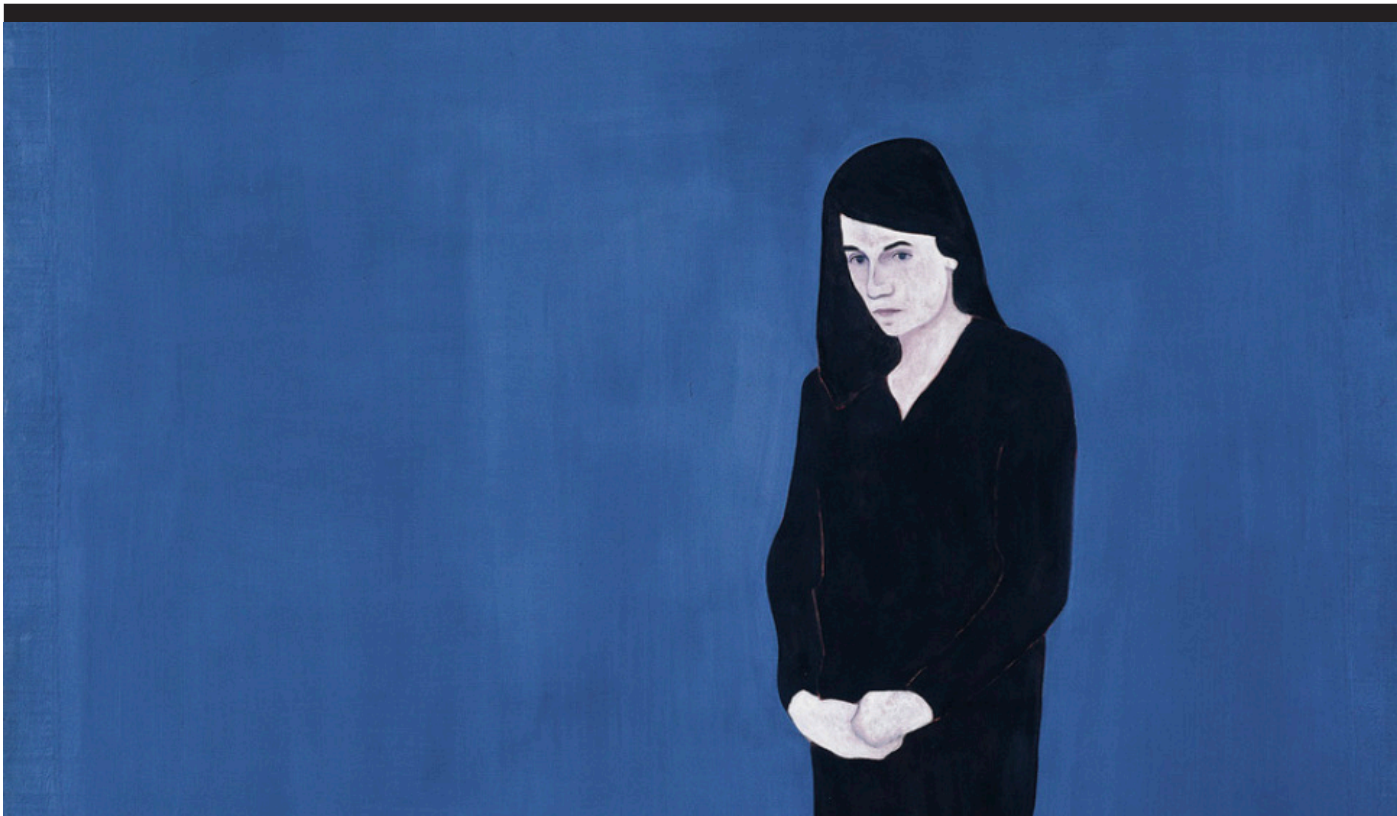
Djamel Tatah, Sans titre , huile et cire sur toile et bois, 220x200x2,5 cm. Collection Frac PACA.

Représenter des corps pour parler de soi et des autres. Dans l'œuvre de Djamel Tatah, un corps est peint sans contexte, isolé, dans un silence bleu. L'esquisse d'un visage nous donne à lire l'autre, son être, sa solitude et nous renvoie à nos introspections individuelles.