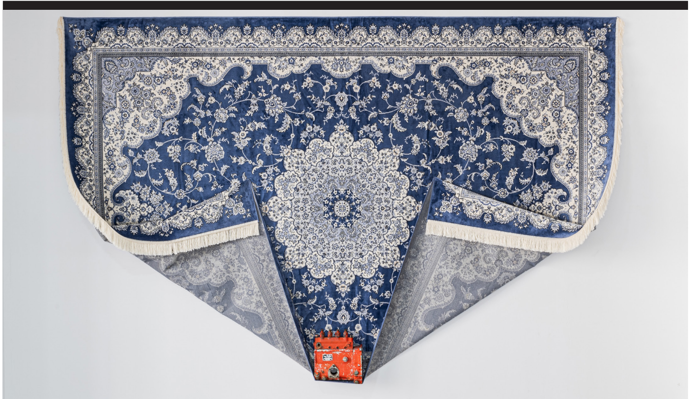
Sadek Rahim, Made in URSS , 2019, tapis, pompe à injection, 122 x 185cm.

Dans la grande Histoire, il y a souvent les petites histoires qui viennent éclairer les grands récits, les contredire, les nuancer.