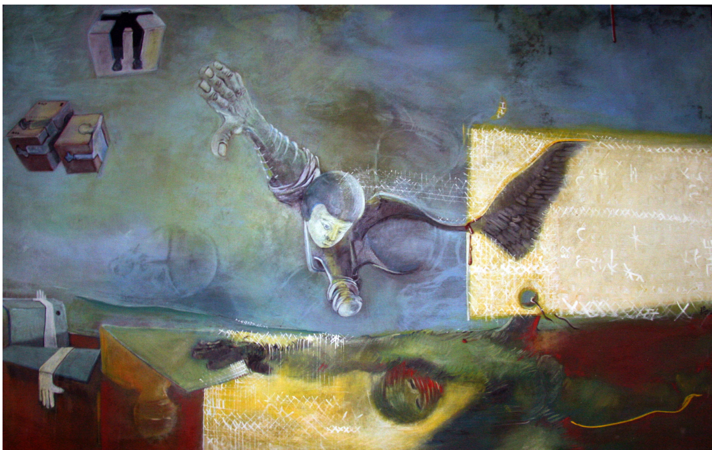
Hellal Zoubir, Icare , 1978, huile sur toile, 199,5 x 124 cm.