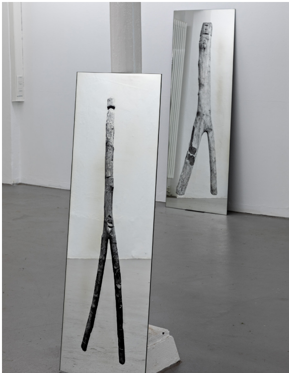
Stick men, Alexandra Leykauf, 2021