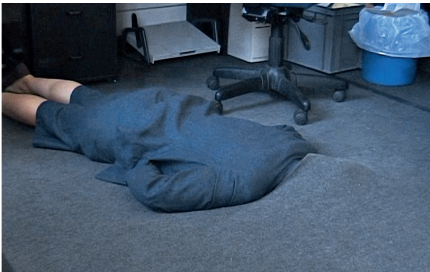
Sofia Hultén, Grey Area , 2001. Vidéo, 9 min. boucle.