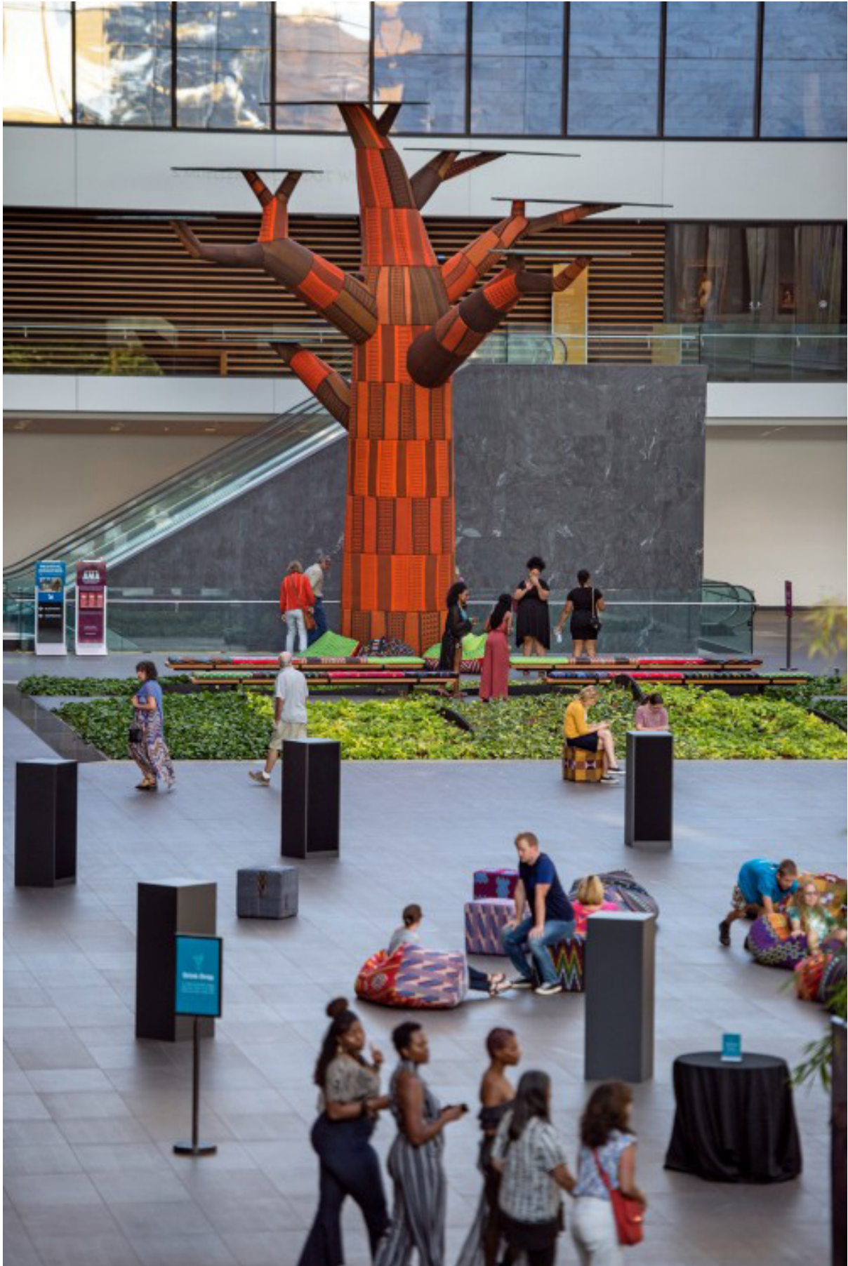
ÁMA: The gathering place , Emeka Ogboh, Cleveland Museum of Art (Ohio, États-Unis), 2019.