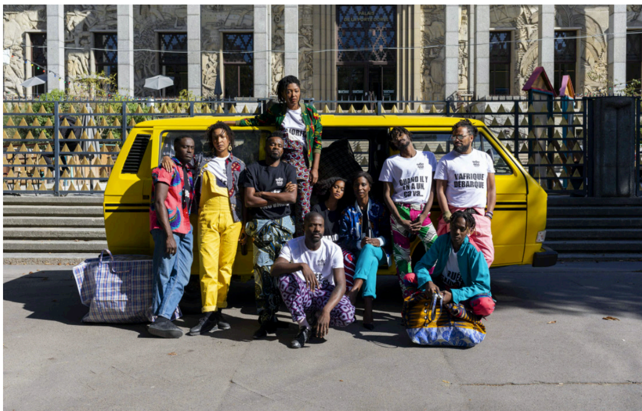
SufferHead Original (Paris Edition) #3, Palais de la Porte Dorée, 2019