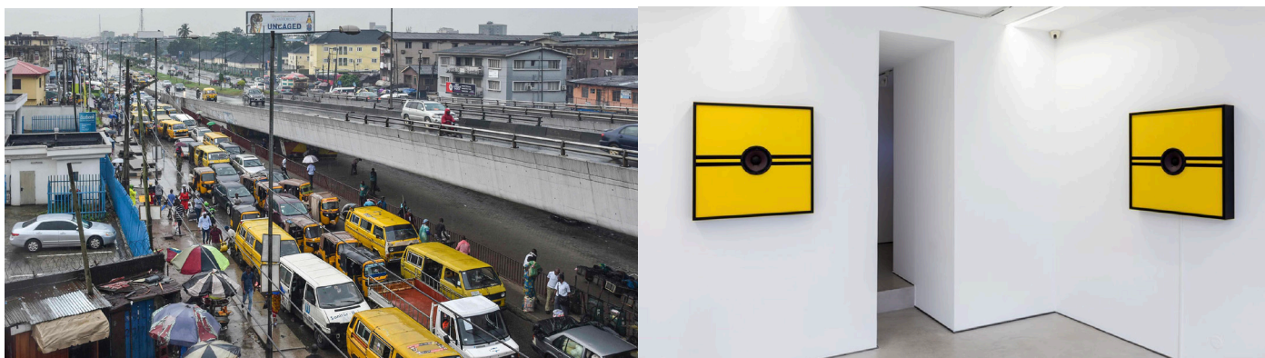
A gauche : vue du quartier périphérique de Lagos : Ojuelegba ; A droite l'installation sonore No condition is permanent composée essentiellement d'œuvres tirées du projet Lagos Soundscapes , 2018, Galerie Imane Farès.