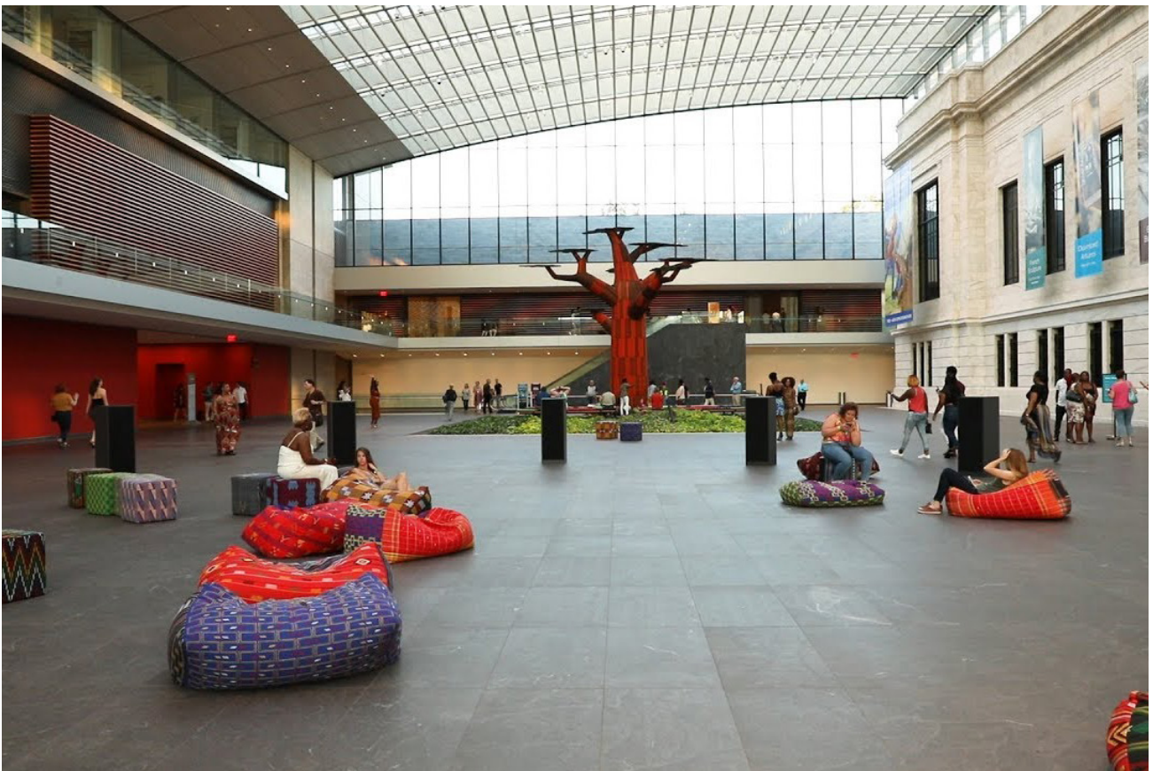
ÁMA: THE GATHERING PLACE