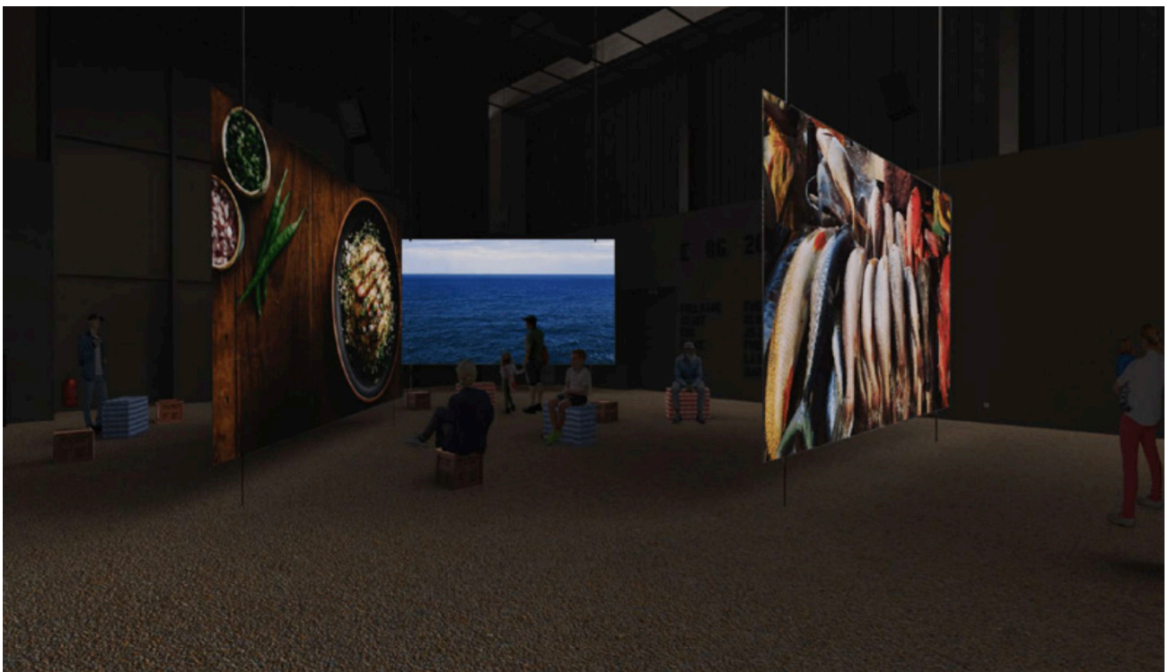
Préfiguration de l'installation au Panorama