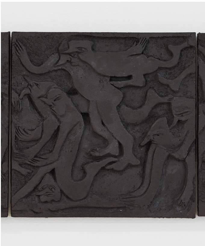
Carlotta Bailly-Borg, In a solid state (détail de l'oeuvre), 2020. Grès.