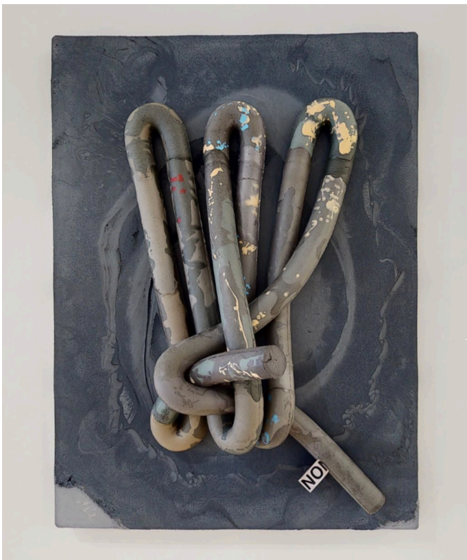
Gaillard & Claude, Baloney! , 2020. Polyuréthane, polyester, aluminium